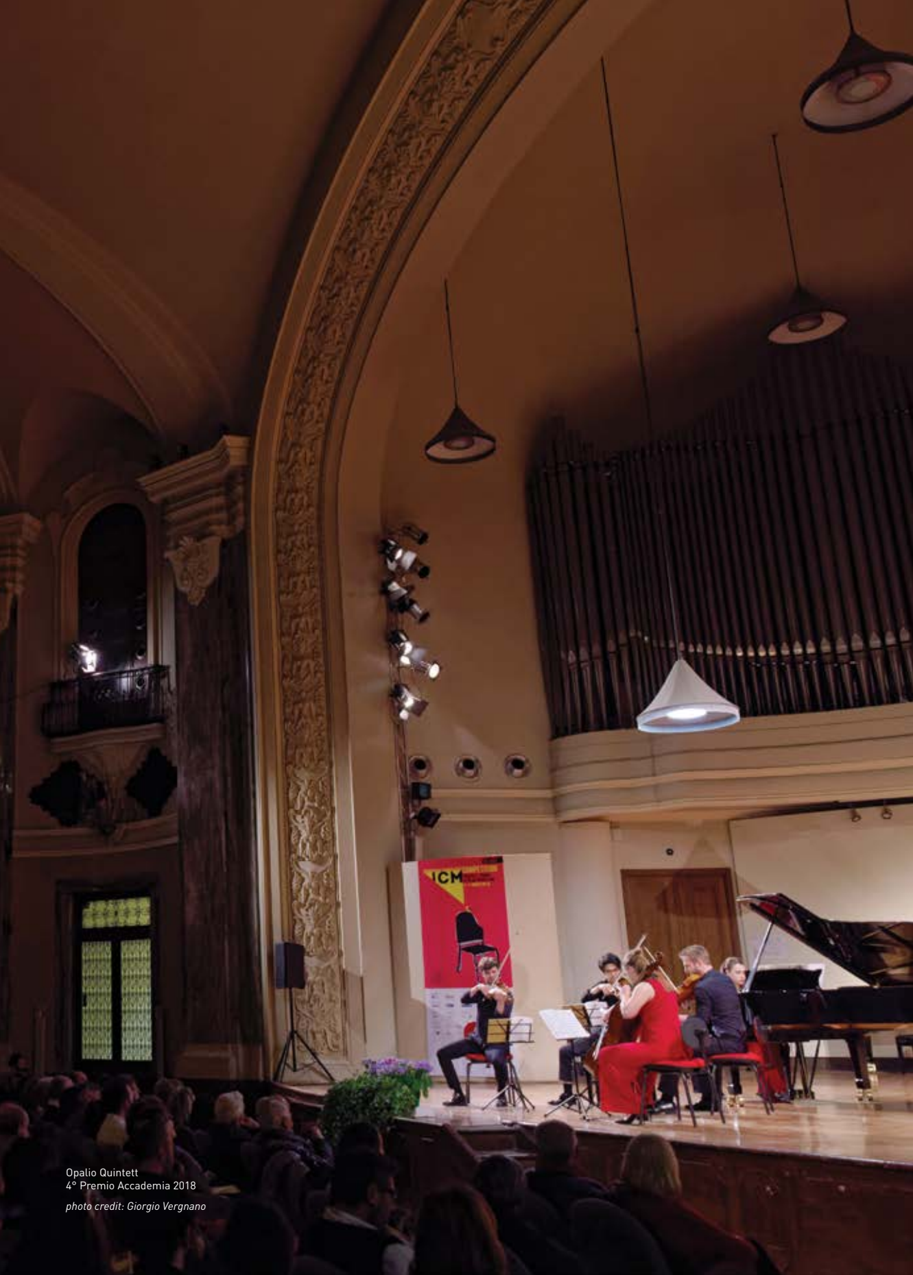
Opalio Quintett 4° Premio Accademia 2018