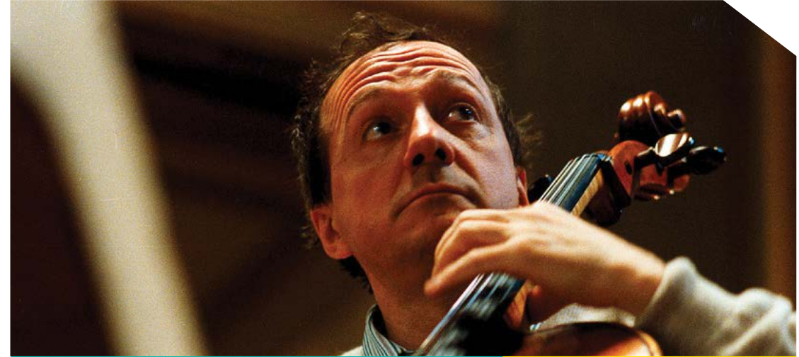
Miklós Perényi / violoncello

Nel gennaio 2003 ha diretto a Cagliari la prima assoluta di "Notti Sylvane" di Sylvano Bussotti e nell'ottobre 2003 ha diretto all'Opera House di Sydney con 6 recite di Madama Butterfly di Puccini. Nella stagione 2003/04 ha diretto 5 programmi con la Auckland Philharmonia, in aprile 2004 ha diretto 2 concerti sinfonici per il Teatro Bellini di Catania e 3 rappresentazioni de "La Serva Padrona" di Paisiello all'Inaugurazione del Teatro Sangiorgi di Catania sempre con l'Orchestra del Teatro Bellini. È tornato a Catania per 2 concerti nella stagione sinfonica nell'aprile 2005. Nel luglio 2004 ha diretto 3 concerti con l'Orchestra dell'Accademia della Scala. Nel 2005 ha debuttato con due concerti con la Philharmonia Enescu a Bucarest ed ha registrato, al Teatro Bellini di Catania, il dvd della "Serva Padrona" di Paisiello (prima registrazione mondiale in dvd) per Fabula Classica. Nel 2007 ha debuttato con la Sinfonica Siciliana a Palermo. Dal 2008 insegna musica da camera al Conservatorio "G. Verdi" di Torino. Nell'ottobre 2009 ha diretto a Lecce, Carlo Grante Solista, la prima assoluta di Concerto Italiano di Roman Vlad. È stato Direttore del Conservatorio "G. Verdi" di Torino.